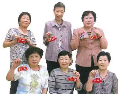
▶作り方◀ 守口市老連東ブロック女性部