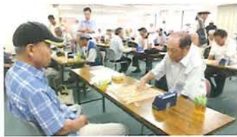
府知事杯をめざして猛者たちが熱戦

SC大阪の第42回囲碁大会、第40回将棋大会が8月26日、府社会福祉会館で開かれ、府内8ブロックの代表40人(囲碁24人、将棋16人)が熱戦を繰り広げました。