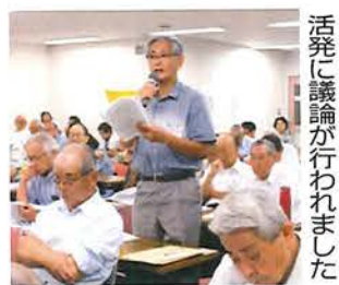
活発に議論が行われました