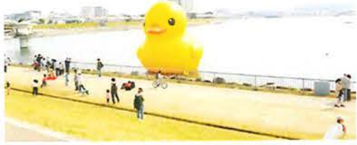
狭山池築造1400年を記念して展示されたラバー・ダック

狭山池は、飛鳥時代(西暦616年頃)に築造され、「古事記」や「日本書紀」にも記述がある日本最古のため池です。奈良時代の行基や鎌倉時代の重源、江戸時代初期の片桐且元など、歴史上著名な人物が改修にかわり、狭山池は多く