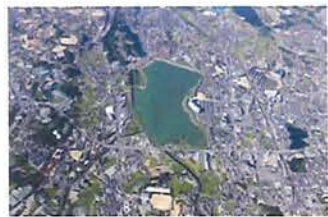
上空から見た狭山池